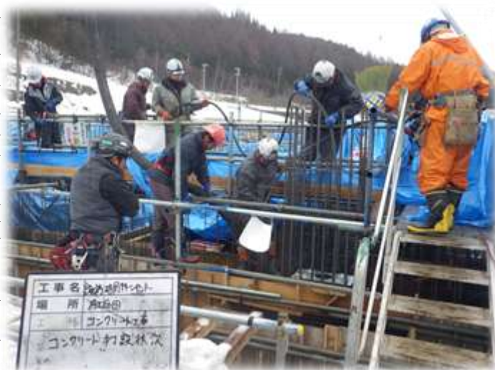
A工区② 基礎コンクリート打設状況