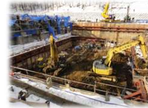
ごみピット掘削状況