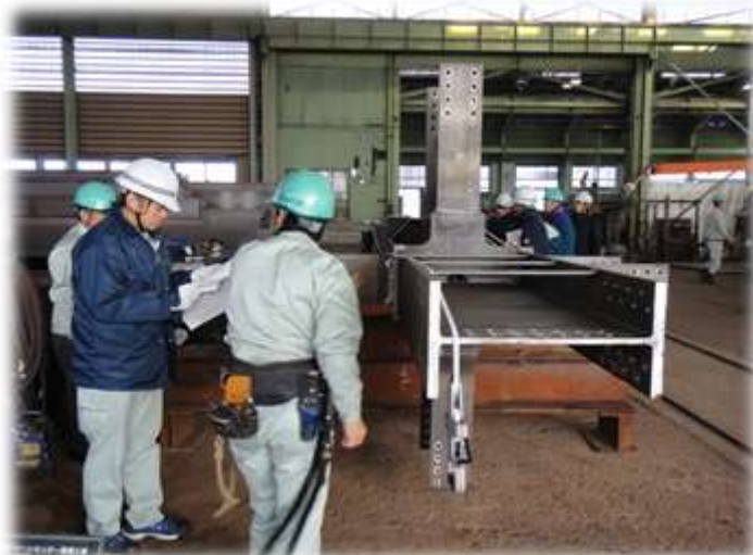
鉄骨検査状況(工場検査)