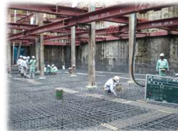
地下コンクリート躯体工事(イメージ)