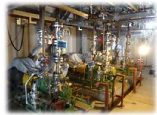
各所配管工事(イメージ)