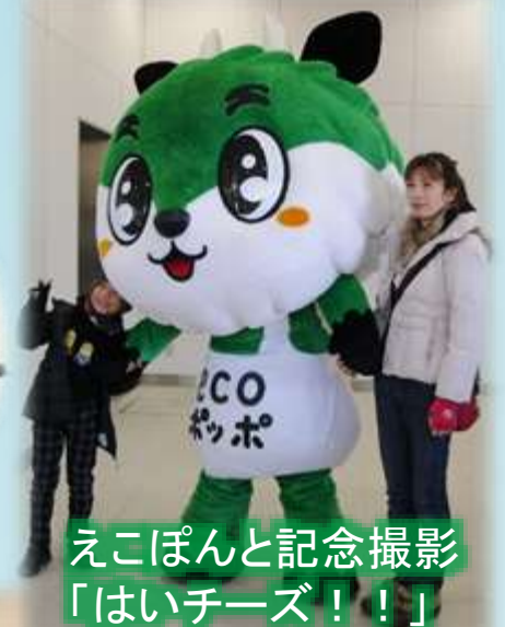
エコぽんと記念撮影「はいチーズ!!!」