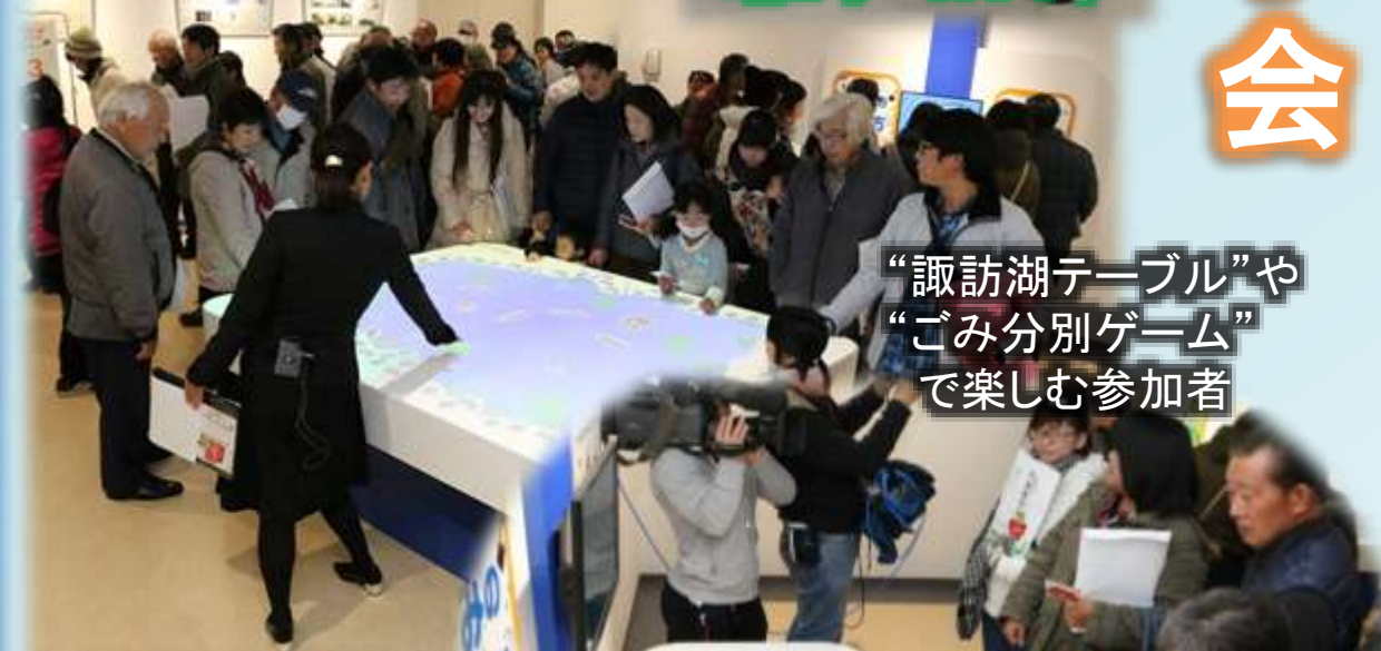
“諏訪湖テーブル”や“ごみ分別ゲーム”で楽しむ参加者