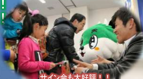
サイン会も大好評!!!