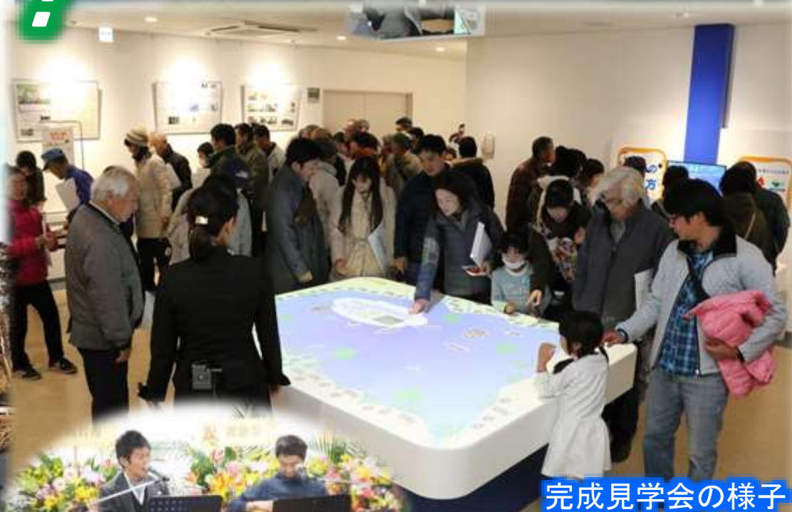
完成見学会の様子