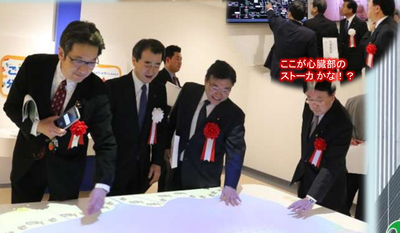
ここが心臓部のストーカかな!?